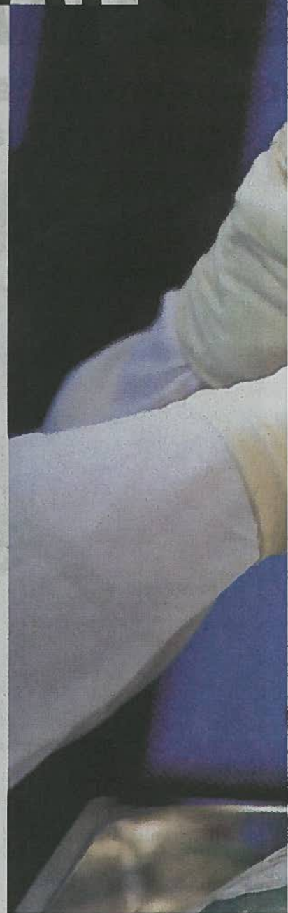
Numărul de celule stem prelevate inclusiv la maturitate, nu doar în cop